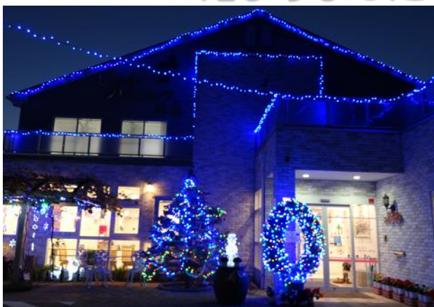
クリニックのイルミネーション